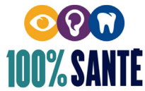
TABLEAU DES GARANTIES ACTISAN